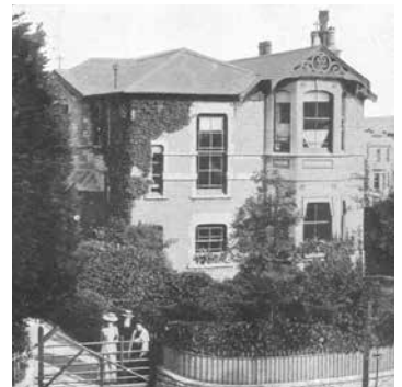
Baedekers Haus in Weston-super-Mare