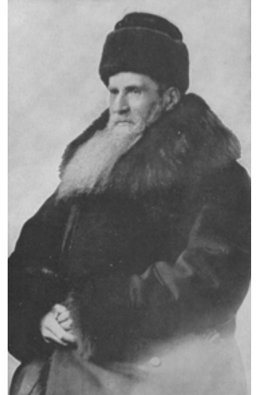
Baedeker im russischen Pelzrock

(zuerst erschienen in: Perspektive 12/2006, S. 22–25)