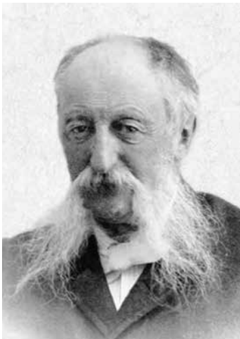
Wassilij A. Paschkow

Russland, um die Neubekehrten zu unterrichten und den Funken der Erneuerung zu verstärken. Unter den Erweckten war Graf Modest Modestowitsch Korff (1842–1933), Zeremonienmeister des Zaren. Außerdem lebte dort der frühere Gardeoberst Wassilij Alexandrowitsch Paschkow (1831–1902), einer der reichsten Gutsbesitzer Russlands, der nach seiner Bekehrung durch Radstock viel Geld für die Ausbreitung des Evangeliums zur Verfügung stellte und selbst unermüdlich predigte. In seinem schlossähnlichen Haus am Newa-Quai, das große Säle umfasste, begann man Mitte der 80er Jahre mit evangelistischen Veranstaltungen in russischer Sprache. Teilweise waren bis zu 700 Personen anwesend. Die neue Bewegung wurde so stark mit seiner Person verbunden, dass ihre Anhänger zeitweise »Paschkowiten« genannt wurden.