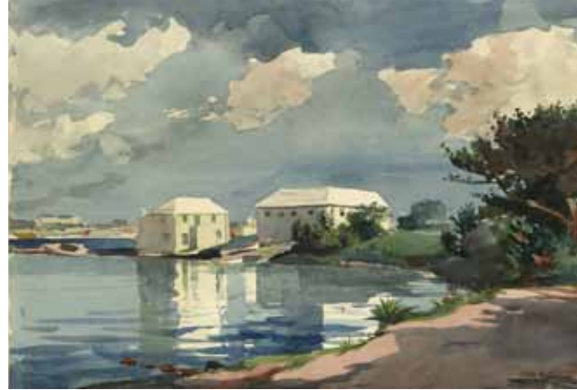
Salt Kettle, Bermuda (Aquarell von Winslow Homer, 1899)

Im Jahr 1880 kam er nach Des Moines und übernahm das Pfarramt