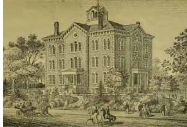
Monmouth College (1863)