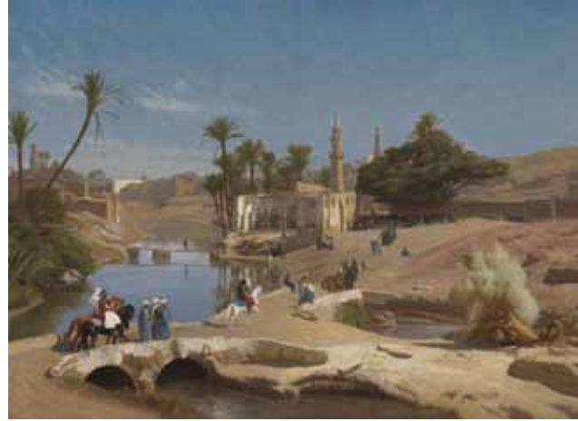
Medinet-Fayum (Gemälde von Jean-Léon Gérôme, 1868/70)

Seine Ansichten über die Themen Kirchenorganisation, Ordination usw. haben sich plötzlich verändert. Im Frühjahr 1873 kehrte er aus Ägypten zurück, trat aus der Vereinigten Presbyterianischen Kirche aus, schloss sich den Plymouth-Brüdern an und hat seitdem mit ihnen und für sie gearbeitet. 3