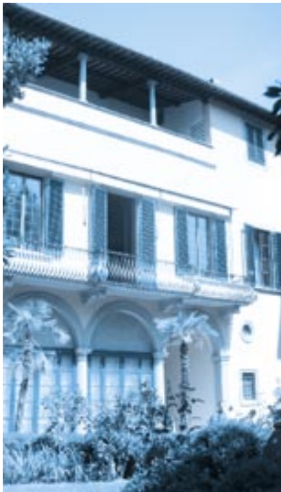
Palazzo Guicciardini, Cortina

Obwohl gut gemeint, hatte die Schrift fatale Auswirkungen. Viele Leser verstanden sie so, als ob sich die „freien christlichen Gemeinden“ damit als die allein richtige Kirche darstellen wollten, und distanzieren sich von diesem „exklusiven“ Anspruch. Selbst die Verbindung zu den englischen „Brüdern“ brach zeitweise ab und konnte erst 1865 durch eine Englandreise Rossettis mühsam wieder-