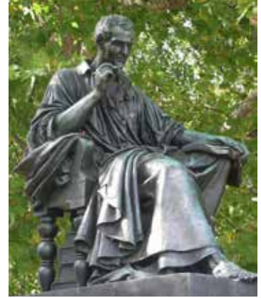
Denkmal Rousseaus in Genf

Nachdem wir nun einige Hauptideen Rousseaus nachgezeichnet haben, dürfte aufgefallen sein, dass manche Aspekte seines Denkens widersprüchlich sind. Es mag aber auch klar geworden sein, wo heute die Anknüpfungspunkte an sein Denken liegen: Viele glauben nach wie vor, dass der Mensch von Natur aus gut sei, oder betrachten die Gesellschaft als verantwortliche Institution für alles Negative. Dies führt u. a. dazu, dass persönliche Schuld relativiert und die Schuld anderer zum Teil maximiert wird (von der Notwendigkeit der Umkehr nach biblischem Maßstab noch gar nicht zu reden). Erfolgt eine Korrektur der ursprünglichen Bedürfnisse, kann der Vorwurf erhoben werden, nicht mehr authentisch sein zu können und/oder diskriminiert zu werden.