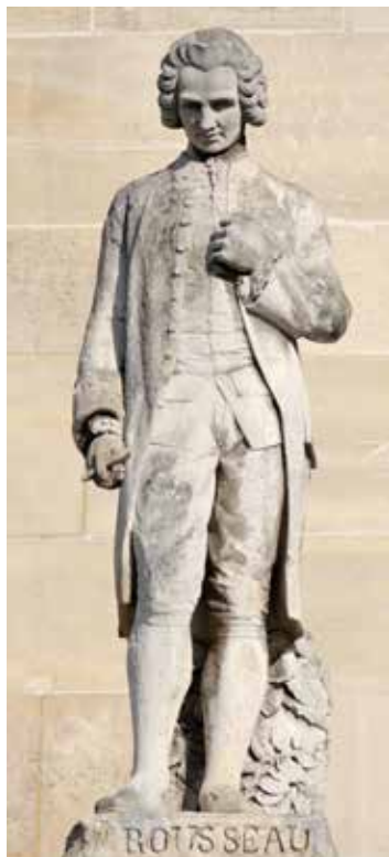
Statue Rousseaus im Louvre, Paris

ditionell gedacht war. Es geht dann für den Einzelnen nicht mehr um die Einübung intellektueller, sozialer und moralischer Kompetenzen, die für die Zugehörigkeit zur Gesellschaft notwendig sind. Im Gegenteil: Bei der Erziehung nach Rousseau geht es jetzt darum, die Person in einer Weise reifen zu lassen, die sie genau vor den kulturellen Einflüssen schützt, die die traditionelle Schulbildung kultivieren soll. Diese führe nämlich dazu, sich von dem zu entfremden, wer man wirklich ist. Sie raube einem die Authentizität.