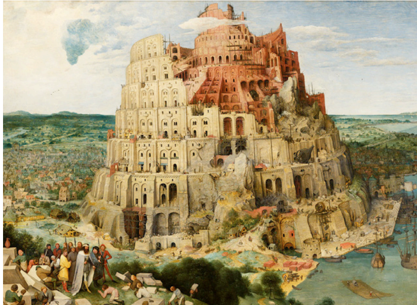
Pieter Bruegel der Ältere: Großer Turmbau zu Babel (1563); Kunsthistorisches Museum Wien

Der Staat ist ein Bollwerk gegen das Chaos. Der Trieb des Menschen zur individuellen Selbstbehauptung, der nur Anarchie produziert, muss sozusagen eingegrenzt werden. Das staatliche Gewaltmonopol ist die natürliche und gute Konsequenz daraus. Es kann eben nicht sein, dass sich jeder Recht zu schaffen sucht, selbst wenn er im Recht ist. Sehr schön ist das erkennbar in kleinen Einzelheiten des Alten Testaments. Man kann sich sogar zu der Aussage vorwagen: Jeder Staat ist besser als kein Staat, insofern er eben verhindert, dass der Mensch seiner Wolfsnatur die Zügel schießen lassen kann.